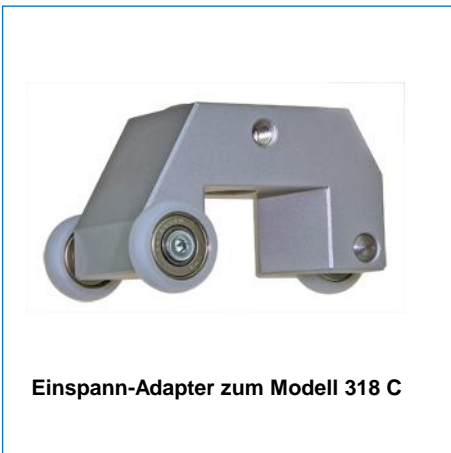
Einspann-Adapter zum Modell 318 C

testing equipment for quality management