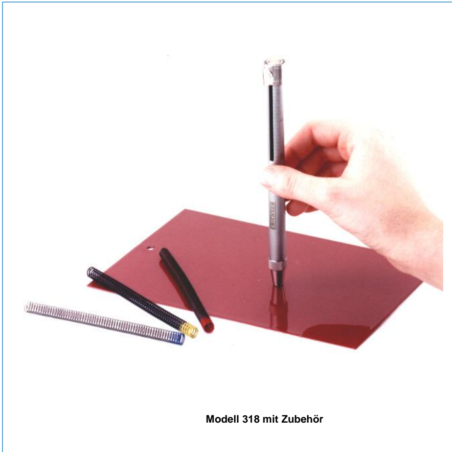
Modell 318 mit Zubehör