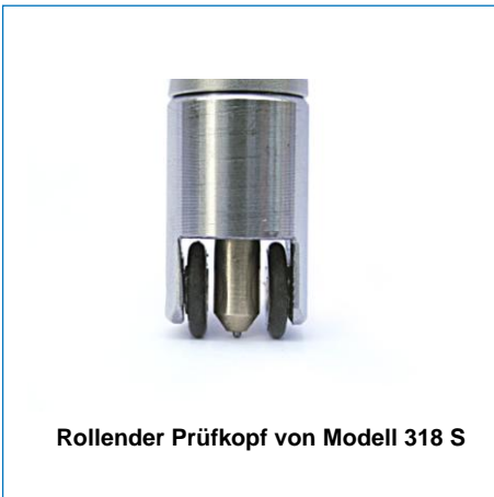
Rollender Prüfkopf von Modell 318 S