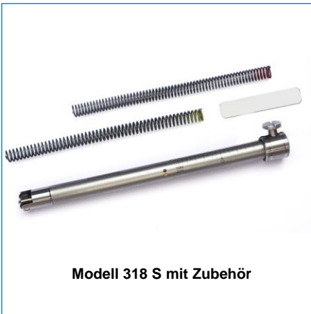
Modell 318 S mit Zubehör