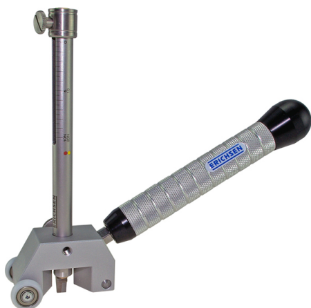
Abb. Modell 318 C mit Einspann-Adapter und Griff

Hier sorgen die drei Polyamidräder für die entsprechende Stabilität beim senkrechten Aufsetzen sowie der Führung.